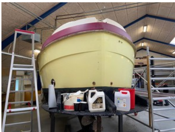
Bådbyggeri på TOPVIRK