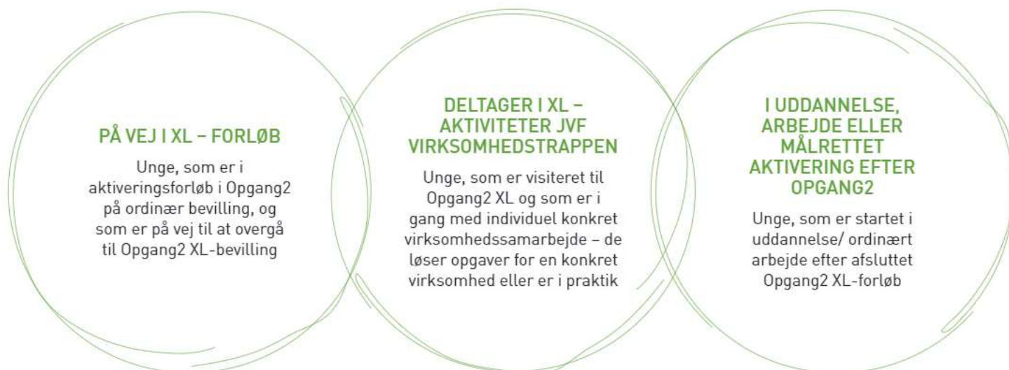
FIG. 4: XL- NETVÆRKSGRUPPEN RUMMER UNGE, SOM ER KNYTTET TIL XL-INITIATIVET PÅ 3 FORSKELLIGE MÅDER

Formen er en rundbordssamtale, hvor alle efter tur fortæller om deres aktuelle situation i relation til XL. Det kan være gode oplevelser i forhold til praktikken, i forhold til mennesker, de har mødt eller løsning af opgaver. Det kan også være udfordringer, bekymringer og angst, som man har skullet tackle, eller står midt i.