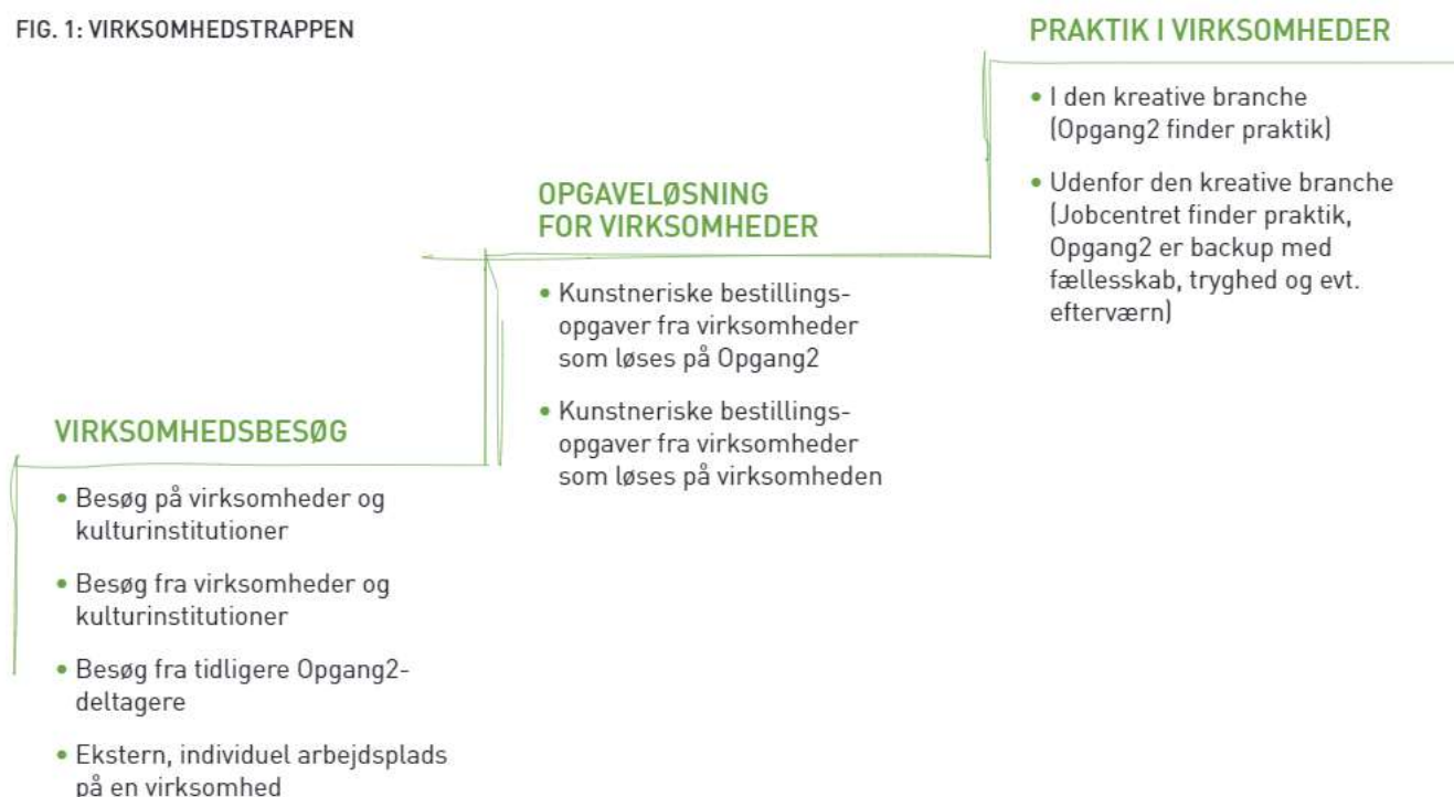
FIG. 1: VIRKSOMHEDSTRAPPEN

Alle praktikker er tilrettelagt med en indledende snusepraktik af ca. 14 dage. Praktikkerne har forskellig fylde og længde, både hvad angår timetal pr uge og varighed, og kan kombineres med deltagelse i værkstedsarbejde i Opgang2.