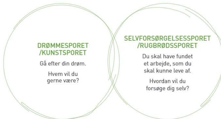
FIG. 3: VEJLEDERENS SAMTALERUM / SAMTALER I TO SPOR

Det er en central pointe, at der italesættes en bevidsthed om, at den enkelte unge IKKE står overfor et valg mellem et 'enten-eller' men kan forfølge et 'både-og' i forhold til drømmespor og selvforsørgelsesspor.